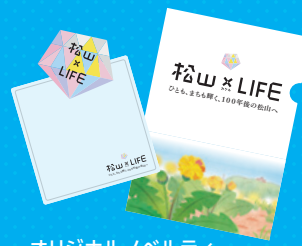
オリジナルノベルティ ● 付箋紙 ● ハンドタオル ● クリアファイル