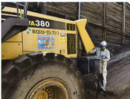
バイオディーゼル燃料購入に係る補助