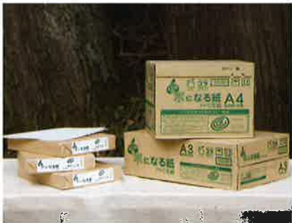
スゴeco 製品 えひめの木になる紙