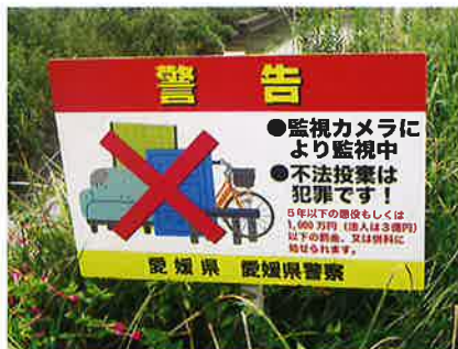
不法投棄防止看板