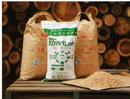
スゴeco 製品 愛がある愛媛ペレット